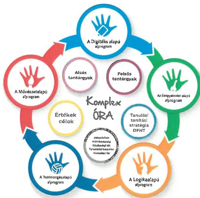
A Komplex órák felépítése